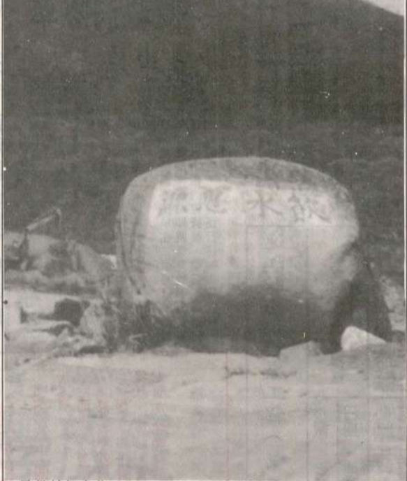
「珠」搶龍雙 由你信不信，在坂里水庫上方...