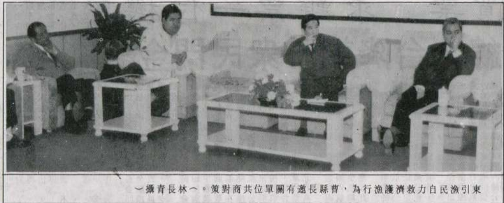
攝青長林。策對商共位單團有遠長縣曹，為行漁護濟救力自民漁東