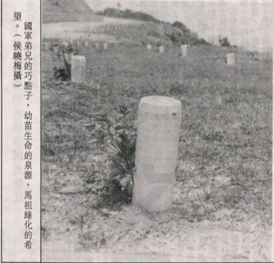
國軍弟兄的巧點子，幼苗生命的源泉，馬祖綠化的希望。