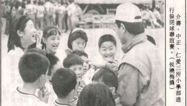
介壽、中正、愛仁三所小學部進行球聯誼賽。