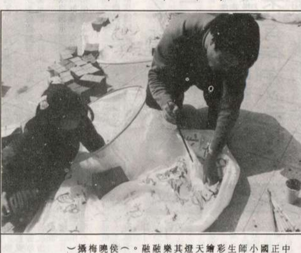
中正國小師生彩繪天燈活動，融樂融融。

「媽祖」姓林小字默娘，係宋明福建莆田縣湄洲島東螺村人，誕生於宋太祖建隆元年(西元九六〇年)至一〇三三年三月廿三日。其父出海不幸遇風覆舟失蹤，默娘痛不欲生乃投海覓親幸得神恩，負父屍漂至南竿塘此一沃口，居民感其孝行，遂將其改葬於此(廟前中央石方即為墓穴)。 此沃口為「媽祖」立廟奉祀，遂稱「天后宮」。宋明時期，此沃口為「媽祖」立廟奉祀，遂稱「天后宮」。宋明時期，此沃口為「媽祖」立廟奉祀，遂稱「天后宮」。