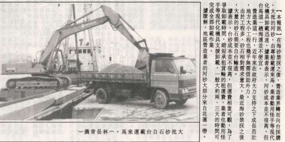
攝青長林。馬來運載台自石砂批大