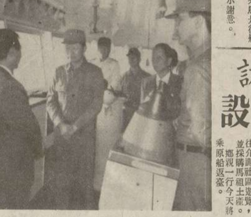
金門親訪鄉門 參訪地方建設