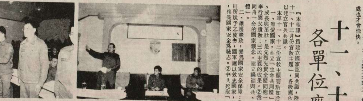
司令官親臨指導 十一月份榮團會