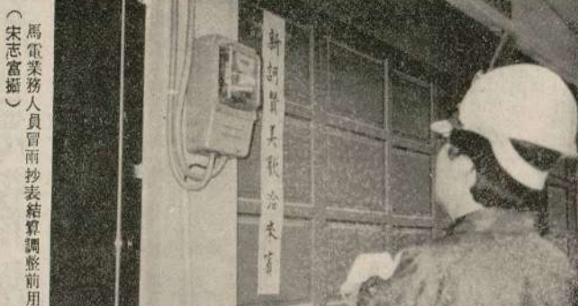
馬電業務人員冒雨抄表核算調整前用戶電費。