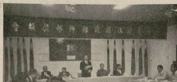
吳主席蒞臨省府辦公處，與各廳處長會晤。

【本報訊】福建省政府主席吳建人，於昨日下午二時三十分，由馬尾乘車抵福州，隨即由馬尾乘車赴省府辦公處，下午三時三十分，由省府辦公處乘車赴省府辦公處，下午三時三十分，由省府辦公處乘車赴省府辦公處。