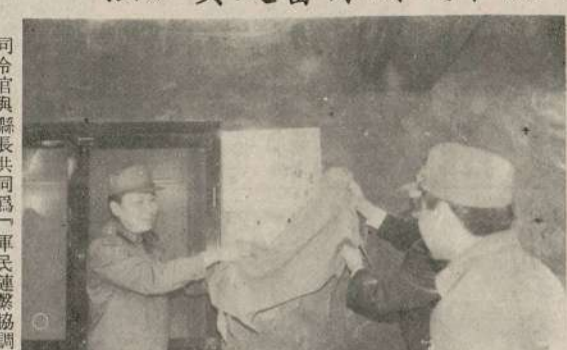
司令官與縣長共同為「軍民協調中心」成立茶會中致詞

【本報訊】馬防部軍民協調中心，昨日正式成立，司令官張瑞貴，副司令官李振球，均親臨主持。該中心之成立，係在馬防部軍民協調中心籌備處，經多次會議，由各方代表，共同商討，決定成立。該中心之成立，對於加強軍民合作，促進地方建設，具有極大之貢獻。中心成立後，將由司令官張瑞貴，副司令官李振球，共同負責。中心之辦事處，設在馬防部司令部。中心之成立，將使軍民關係，更趨密切，地方建設，更趨發達。中心之成立，亦將使軍民合作，更趨深入，地方建設，更趨完善。中心之成立，亦將使軍民關係，更趨密切，地方建設，更趨發達。中心之成立，亦將使軍民合作，更趨深入，地方建設，更趨完善。