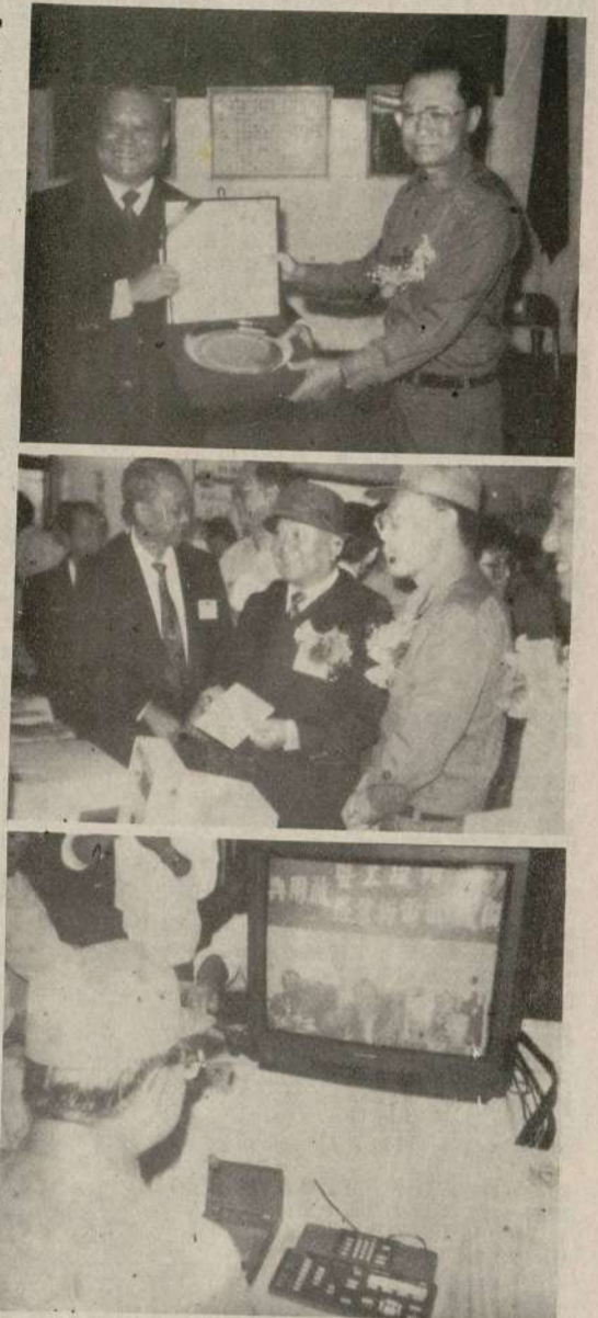
在表演節目告一段落之後，慶祝酒會隨即開始，馬次長及司令官相繼致詞，對電訊事業發展而祝賀，場面溫馨熱烈。

【本報訊】臺灣光纖海纜竣工及開放郵電新業務典禮，昨日在馬祖舉行，由馬祖防務司令部司令官馬祖、副司令官馬祖、參謀長馬祖、副參謀長馬祖、及各級官員、地產各界首長代表等百餘人參加。 馬祖長在致詞後代表交通部長官及新設防務司令部司令官及軍政首長紀念牌，司令官也以一功在連江一紀念牌贈與。 典禮由上午十時在介壽國中禮堂舉行，交通部次長馬祖、國防部次長馬祖、防務司令部司令官馬祖、副司令官馬祖、參謀長馬祖、副參謀長馬祖、及各級官員、地產各界首長代表等百餘人參加。 馬祖長在致詞後代表交通部長官及新設防務司令部司令官及軍政首長紀念牌，司令官也以一功在連江一紀念牌贈與。