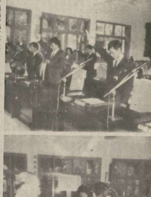
曹常順昨日在縣政府禮堂宣誓就職，由福建省政府委員陳仁官主持，各單位首長、民意代表及縣府官員出席。

【本報訊】馬祖地方自治首任縣長曹常順，昨日在縣政府禮堂舉行宣誓就職典禮。由福建省政府委員陳仁官主持，各單位首長、民意代表及縣府官員出席。曹縣長在致詞時表示，將竭誠服務，為地方建設而努力。