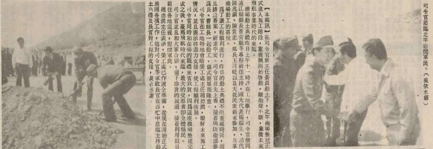
司令官蒞臨北竿機場開工典禮。

【本報訊】司令官蒞臨北竿機場開工典禮，北竿機場整建正式進入工程階段，重慶機關開始動工，機炮聲不絕，象徵未來飛航事業的興隆。