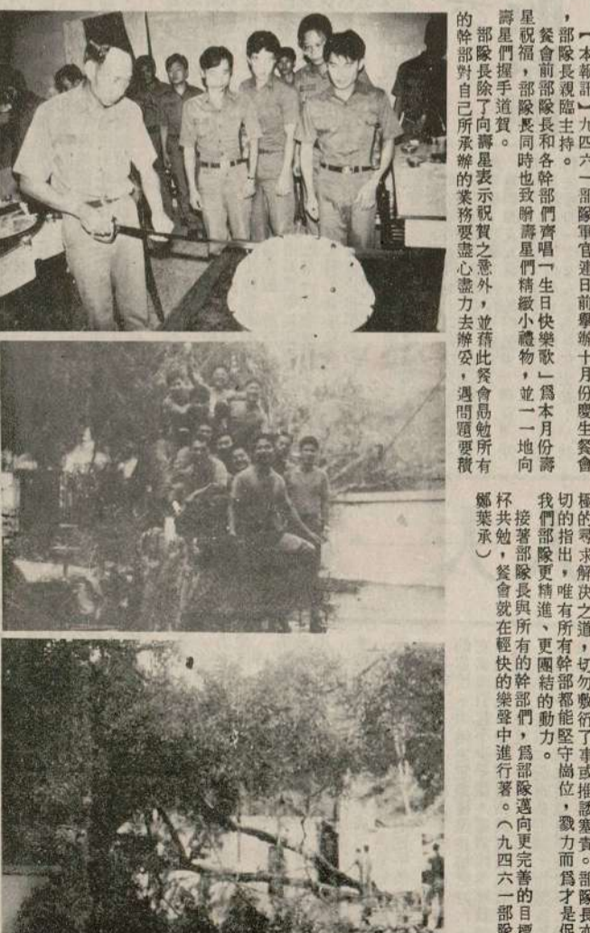
【圖上】九四六一部隊軍官連日前舉辦十月月份慶生會。【圖中】九四六一部隊軍官連日前舉辦十月月份慶生會。

【本報訊】九四六一部隊軍官連日前舉辦十月月份慶生會，部幹部加嚴核考，才人秀優擢拔。部幹部加嚴核考，才人秀優擢拔。 部幹部加嚴核考，才人秀優擢拔。部幹部加嚴核考，才人秀優擢拔。