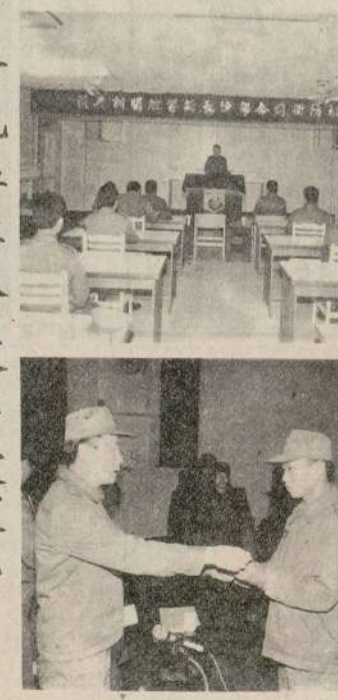
司令官勉勵官兵：「覆巢之下無完卵」，國家有前途，個人前途到社會上，創造個人國家光明前途。

司令官並列舉三項作法，要求幹部確實做到：一、健全自己，教品勵學，贏得官兵尊敬。二、掌握少數優秀人員，落實執行重點工作。三、賞罰分明，德與榮譽，公正誠懇，以獲得官兵尊敬。