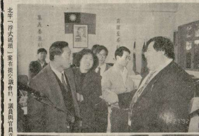
縣臨時會議昨聽取建設、財政、糧食、教育、衛生、及行政室主任報告...