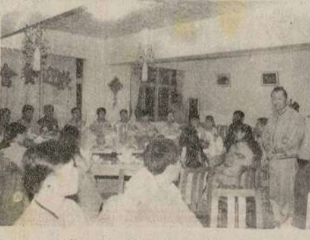
陸軍部總額官注意保健防染感