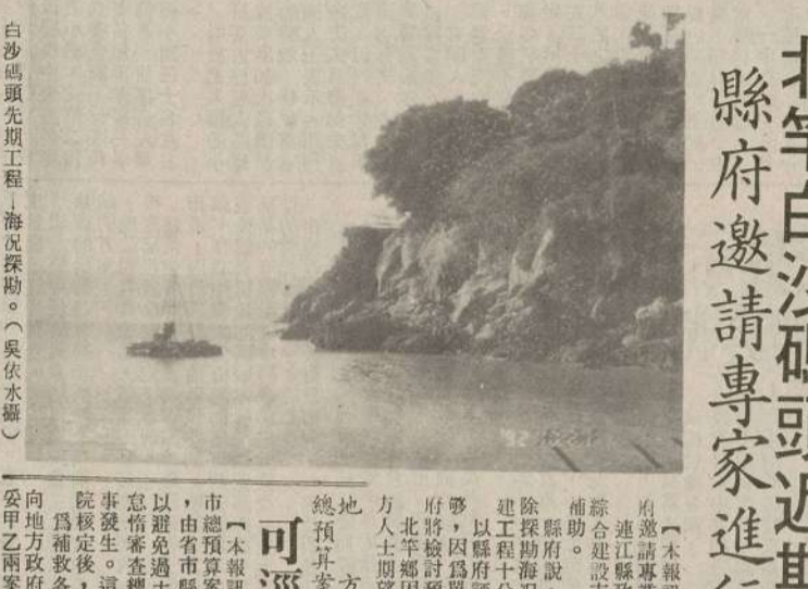
北竿白沙碼頭近期動工興建 縣府邀請專家進行海況探勘

【本報訊】行政院農業委員會八十二年補助漁業發展計畫，業已奉核定，將以一百七十萬經費推動各項漁業發展計畫，以促進漁業生產，增加漁民收入，改善漁民生活，並健全漁業組織，提高漁業生產力。 該計畫內容包括：(一)健全漁業組織功能，辦理漁會改選工作。(二)發展漁業業務，加強財務管理與改進。(三)實施漁業推廣計畫，包括：1. 漁業推廣計畫：由漁會負責，以漁民為對象，推廣漁業技術，提高漁民生產力。2. 漁業推廣計畫：由漁會負責，以漁民為對象，推廣漁業技術，提高漁民生產力。3. 漁業推廣計畫：由漁會負責，以漁民為對象，推廣漁業技術，提高漁民生產力。