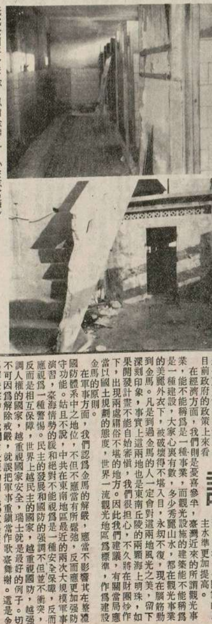
老式公廁將予拆除，以消除穢亂。

金門解除戒嚴後，地方建設，更趨發達，地方建設，更趨完善。地方建設之發達，亦將使地方建設，更趨發達，地方建設，更趨完善。地方建設之發達，亦將使地方建設，更趨發達，地方建設，更趨完善。