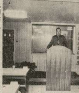
國防部三民主義教育會...

生活點滴 構工記 【本報訊】近日在馬祖地區發生了一些生活點滴，構工記如下。這些點滴反映了當地居民的生活狀況和社會現狀。 近日在馬祖地區發生了一些生活點滴，構工記如下。這些點滴反映了當地居民的生活狀況和社會現狀。 近日在馬祖地區發生了一些生活點滴，構工記如下。這些點滴反映了當地居民的生活狀況和社會現狀。