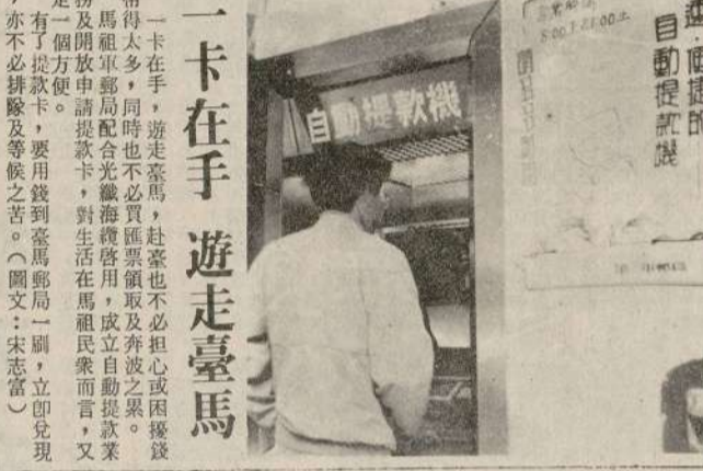
一卡在手 遊走臺馬 馬祖郵局配合光碟海峽運用，成立自動提款機，不僅便利，又省錢。