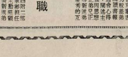
下士邱德聰 主動輔導導正觀念 下士許家彬 協助新進負責盡職