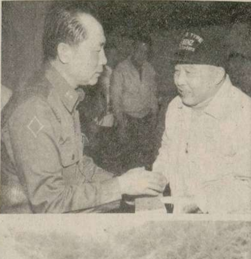
司令官蒞臨主持，各鄉鎮代表蒞會，由防區司令部政訓主任蒞會。

【本報訊】南竿地區六十歲以上老人長春聯誼自強活動，昨（二十四）日假防區司令部，在防區司令官蒞臨主持下，由防區司令部政訓主任、各團長、營長、連長等，分發各鄉鎮，分頭進行。上午八時，各團分頭出發，上午十時，在防區司令部集合，對防區司令部政訓主任蒞臨主持。下午一時，在防區司令部舉行聯誼會，由防區司令官蒞臨主持，各鄉鎮代表蒞會，由防區司令部政訓主任蒞會。下午三時，在防區司令部舉行聯誼會，由防區司令官蒞臨主持，各鄉鎮代表蒞會，由防區司令部政訓主任蒞會。下午五時，在防區司令部舉行聯誼會，由防區司令官蒞臨主持，各鄉鎮代表蒞會，由防區司令部政訓主任蒞會。