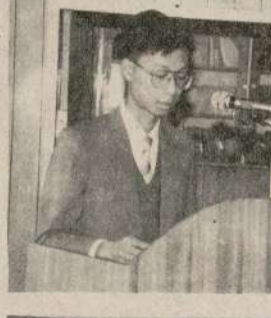
國防部三民主義教育會...