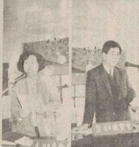
金門快輪改善交通，客艙舒適，服務良好。