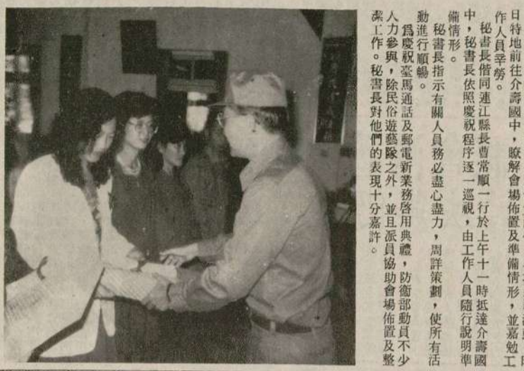
司令官在商節大會中領獎模範商人。

【本報訊】臺灣馬祖海纜竣工及開放郵電新業務啓用典禮，今天在馬祖隆重舉行，馬祖電信事業邁入新里程，軍民信感振奮。 典禮由馬祖防衛司令部、北二總、基隆局、長途局及郵政等單位官員共一百三十多人，在上午十時假馬祖防衛司令部禮堂舉行。典禮由防衛司令部副司令官馬祖防衛司令部副司令官馬祖防衛司令部副司令官主持，由防衛司令部副司令官馬祖防衛司令部副司令官致詞，由防衛司令部副司令官馬祖防衛司令部副司令官致詞，由防衛司令部副司令官馬祖防衛司令部副司令官致詞。 典禮中，防衛司令部副司令官馬祖防衛司令部副司令官致詞，由防衛司令部副司令官馬祖防衛司令部副司令官致詞，由防衛司令部副司令官馬祖防衛司令部副司令官致詞。典禮中，防衛司令部副司令官馬祖防衛司令部副司令官致詞，由防衛司令部副司令官馬祖防衛司令部副司令官致詞，由防衛司令部副司令官馬祖防衛司令部副司令官致詞。