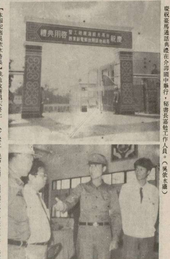
慶祝馬祖通話典禮在介壽國中舉行，秘書長高勉勉工作人員。