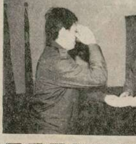
國防部三民主義教育會...