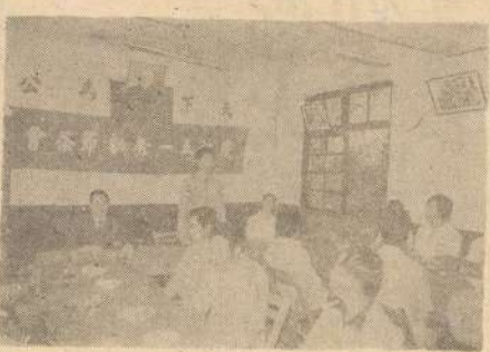
迎江縣政府茶會招待模範勞工（吳依水攝）

臺灣省各縣市政府，索取地籍資料，收補償標準辦法，並針對地籍資料，對民眾不吃虧，政府征收補償估價標準，府可以依法征收用。草案會議，昨日下午二時在縣府會客