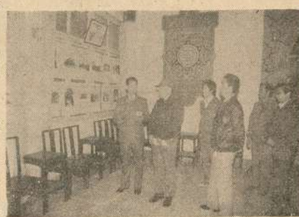
秘書長親覽總誌 蔣公勳業照片展