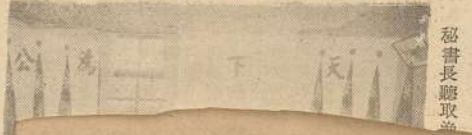
秘書長昨午巡視農改場三等單位

本報訊：秘書長昨午巡視農改場三等單位，指示有效利用海陸資源，指示有示指繁榮農村增加民衆收益。秘書長昨午巡視農改場三等單位，指示有效利用海陸資源，指示有示指繁榮農村增加民衆收益。