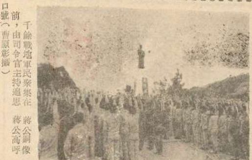
千餘戰地軍民齊集在蔣公銅像前，由司令官主持追思蔣公高呼口號

〔本報訊〕來自各村落、各機關的軍民、學生和婦女代表，昨下午午齊集蔣公銅像前，舉行了一場為領袖而跑運動，使紀念蔣公活動掀起了高潮。 蔣公逝世七週年紀念大會，於昨日下午三時，在蔣公銅像前，舉行了一場為領袖而跑運動，使紀念蔣公活動掀起了高潮。 蔣公逝世七週年紀念大會，於昨日下午三時，在蔣公銅像前，舉行了一場為領袖而跑運動，使紀念蔣公活動掀起了高潮。