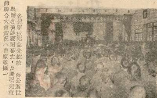
各級學校紀念先總統 蔣公逝世七週年大會開幕式，及慶祝兒童節聯合大會

【本報訊】紀念先總統蔣公逝世七週年，今天上午八時三十分，在梅石中正堂舉行紀念大會，蔣公遺教，表揚各項競賽績優學校學生，並頒發獎狀。大會由縣政府主席主持，蔣公遺教，表揚各項競賽績優學校學生，並頒發獎狀。大會由縣政府主席主持，蔣公遺教，表揚各項競賽績優學校學生，並頒發獎狀。