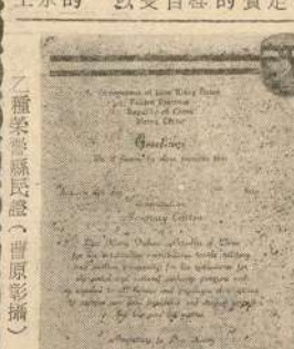
（種榮譽縣民證）