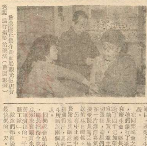
會場中正介商翁觀光飯店賓...