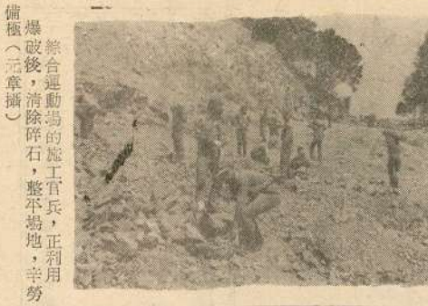
綜合運動場的施工官兵，正利用爆破後，清除碎石，整平場地，辛勞備極。