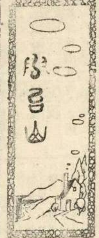
Caption for the landscape illustration.

Vertical text or caption next to the emblem.