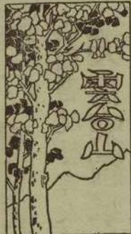
我住在第三招待所...