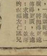
戰鬥營學員 曲靖家