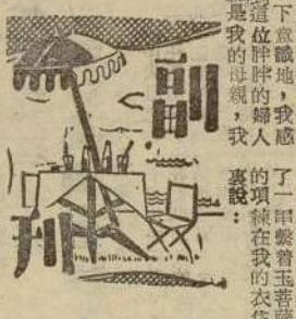
「我誠心的希望母親能原諒父親一時衝動所造成的錯誤，而歸於好的，所以，一天我乘她非常高興時說：『媽，您既然收了，拿刀的拿刀，拿金的拿金，便升入大學部接受專業訓練，例假日也可以自由外出。』」 「第二天放假時，我邀她共遊台北風景勝地——碧潭。」 那天我準備好富麗的野宴，

去年初夏，她寄來一封信長，內述她因事業成績優異，已被保送進入××學院。字裏行間充滿着興奮，快樂或榮高的迫負。 「媽媽，您先是不願讓我去讀軍校的，怕我吃不苦，爸爸却沒有意見，後來媽媽經不起我的懇求，答允了我。」 「你這媽媽是怎樣才肯聽我的？」 「告訴你吧！我打聽出了你這張王爺，我對她說：『媽，如果我不肯聽我的話，張小珍，是女孩子，永遠是聽不見他粗皮及」