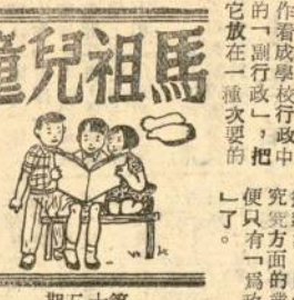
童兒祖馬 第五十期

童兒祖馬 湯金龍 主編 世界上不論哪一個人都有的志願，如果一個人沒有志願，那麼他就不能在這今日生龍活虎的社會裏獲得最後的成功。 我當然是有自己志願的，我希望將來能做一位發明家，可是要做一個發明家並不是一件容易的事情，必須要做處處發疑問，竭力的去探討去研究，這就是要成為發明家的訣訣。 世界上發明家所發明的