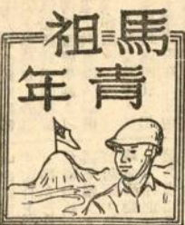
祖馬 年青 第七十期 版出日二月一十期下