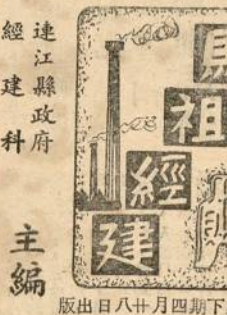
馬祖經建 第五期四月十八日出版