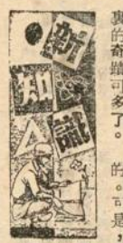
五角大廈辦事細則規定