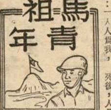
馬祖青年 第六期 出日二月五期下