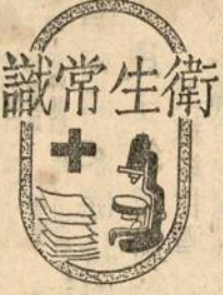
版出日四十月每第三第