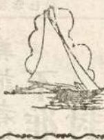
「人定勝天」命運却可以由你。

悲觀消極的宿命論，迷信江湖術士的謊言胡言，那無異是守株待兔。故步自封，實在愚不可及。