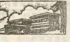
「人定勝天」命運却可以由你。

「人定勝天」命運却可以由你。這是一句成語，是形容凡事如能堅忍到底，沒有不可以成功的。這是一句成語，是形容凡事如能堅忍到底，沒有不可以成功的。這是一句成語，是形容凡事如能堅忍到底，沒有不可以成功的。