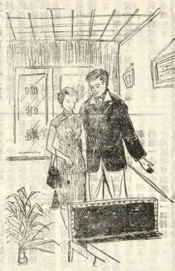
了黑經已天時校學同 子美了到碰我上街在 廳啡咖家一走她拉我