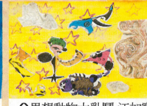
異想動物大亂鬥-江加寶