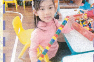
秀茜-積木組合序列