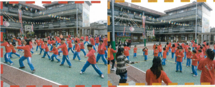
校慶活動-活力健康操及由社區媽媽帶領的舞動童年。