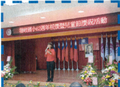
塘岐 62 周年校慶碧雲 校長致詞