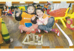
詩棠-城堡裡的小公主