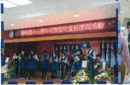
姊妹校-華助國小師生蒞臨塘岐，並以悠揚的樂器歡慶塘岐國小 62 周年校慶