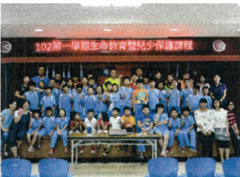
◎生命教育暨兒少保護宣導