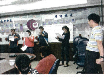
◎性平宣導-家長演出豬家故事