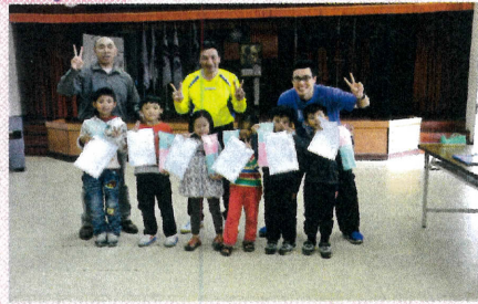
◎一年級注音符號闖關活動

倘若你錯過了11月19日的母語朗讀比賽,那肯定會是個小小的遺憾!看著小朋友大朋友還有「老老」朋友,用熟悉的福州語朗讀,那彼此互動交流的眼神,是世界上最美的語言!