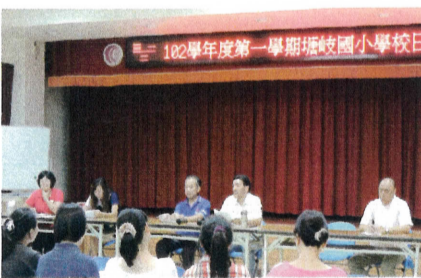
圖 / 文 教務組長 曹祐慈

學校日暨班親會活動 102 學年度第一學期的學校日暨班親會活動於 9 月 17 日晚間登場，活動中，校長、所有行政人員及各班級導師，莫不把握時間向與會的家長們說明本學期為孩子們安排的教學計畫，期間親師的意見交流討論，激盪出不同的火花，也為塘岐校園注入了一股新暖流！