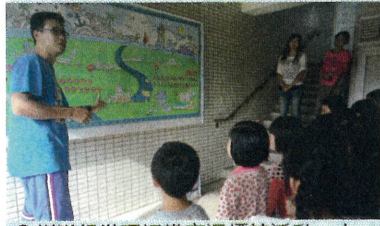
◎輔導組辦理認識交通標誌活動，小朋友聚精會神地聽講。