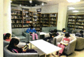
●社區圖書館利用教育