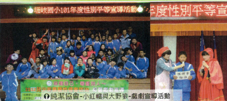
◎純潔協會-小紅帽與大野狼-戲劇宣導活動