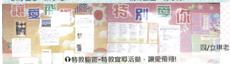
◎特教欄窗-特教宣導活動，讓愛飛翔!