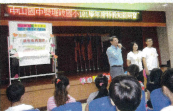
◎生命教育專題演講-讓生命亮起來