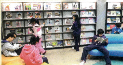
●社區圖書館利用教育