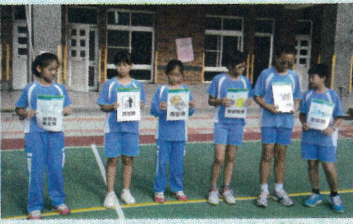
◎認識資源回收的分類，為愛護地球的行動盡一份心力!