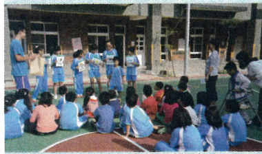
◎經過宣導以後，應該能辨別紙盒包裝分在哪一類了吧!