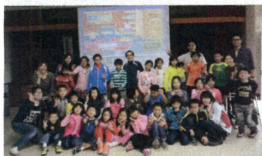
◎校園資訊安全推廣活動