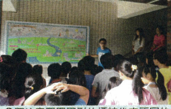
◎要注意不同圖形的標誌代表不同的意義!三角形代表警告，圓形是禁制!