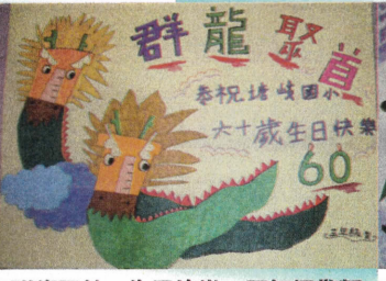
群龍聚首、生日快樂—三年級敬賀