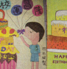
生日快樂—六年級敬賀