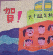
迎向未來—一年級敬賀