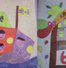
上進有心健康有愛快樂有夢—三年級敬賀