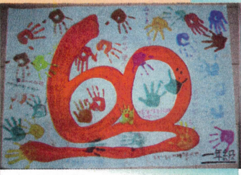
開心過六十一—一年級敬賀