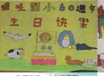
生日快樂—六年級敬賀