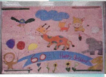
生日快樂—二年級敬賀