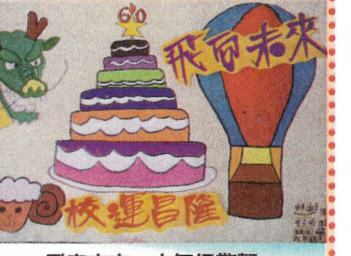
飛向未來—六年級敬賀