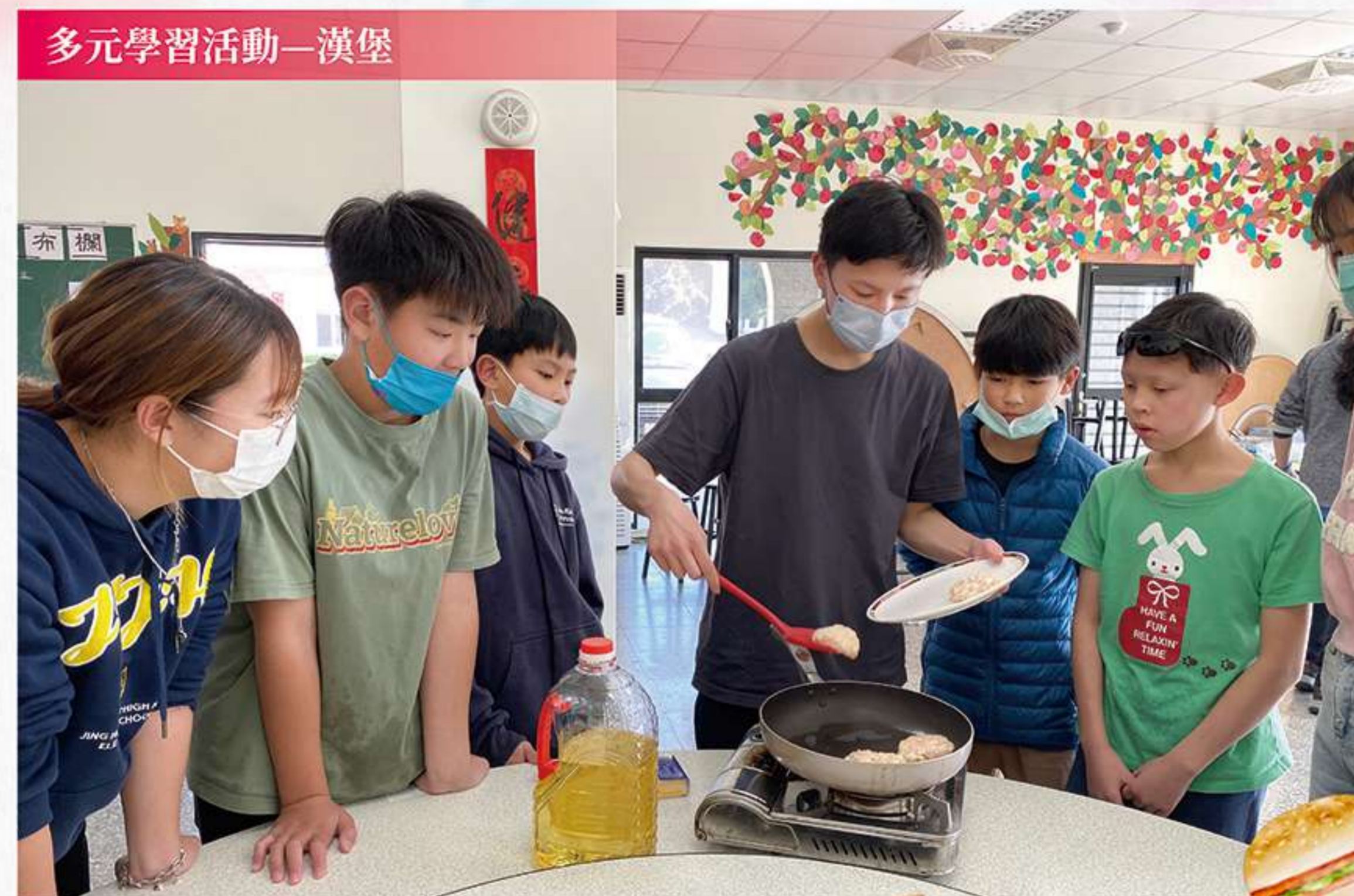
多元學習活動—漢堡