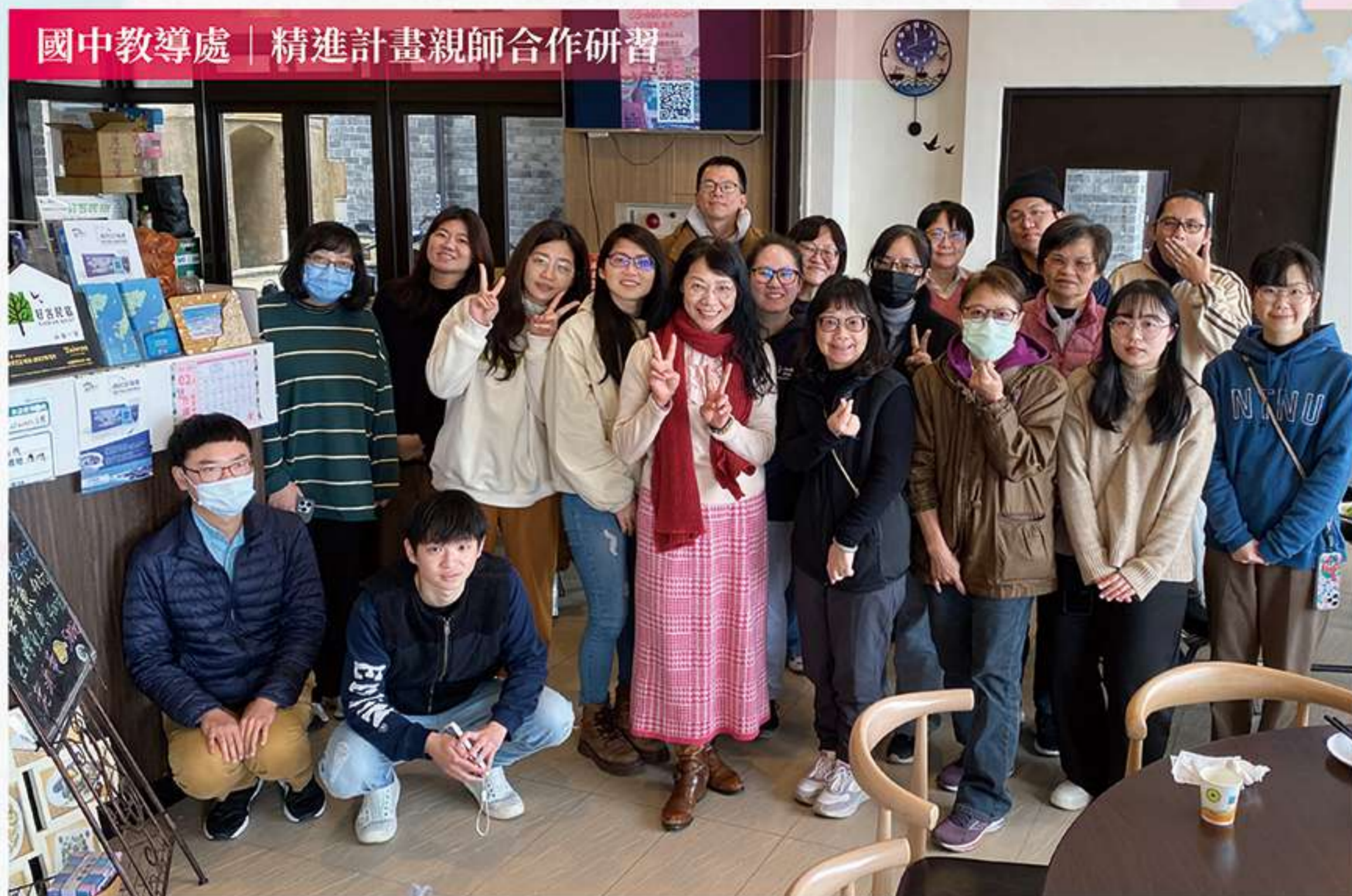
國中教導處 | 精進計畫親師合作研習