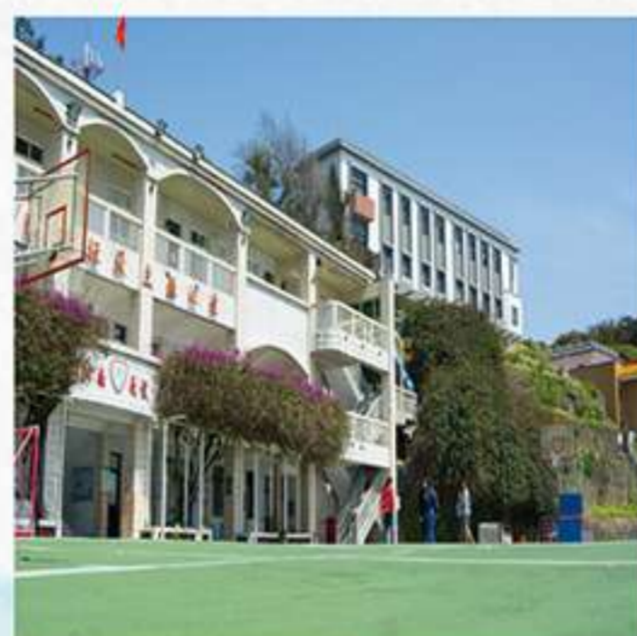
國小教導處 | 考古小玩家