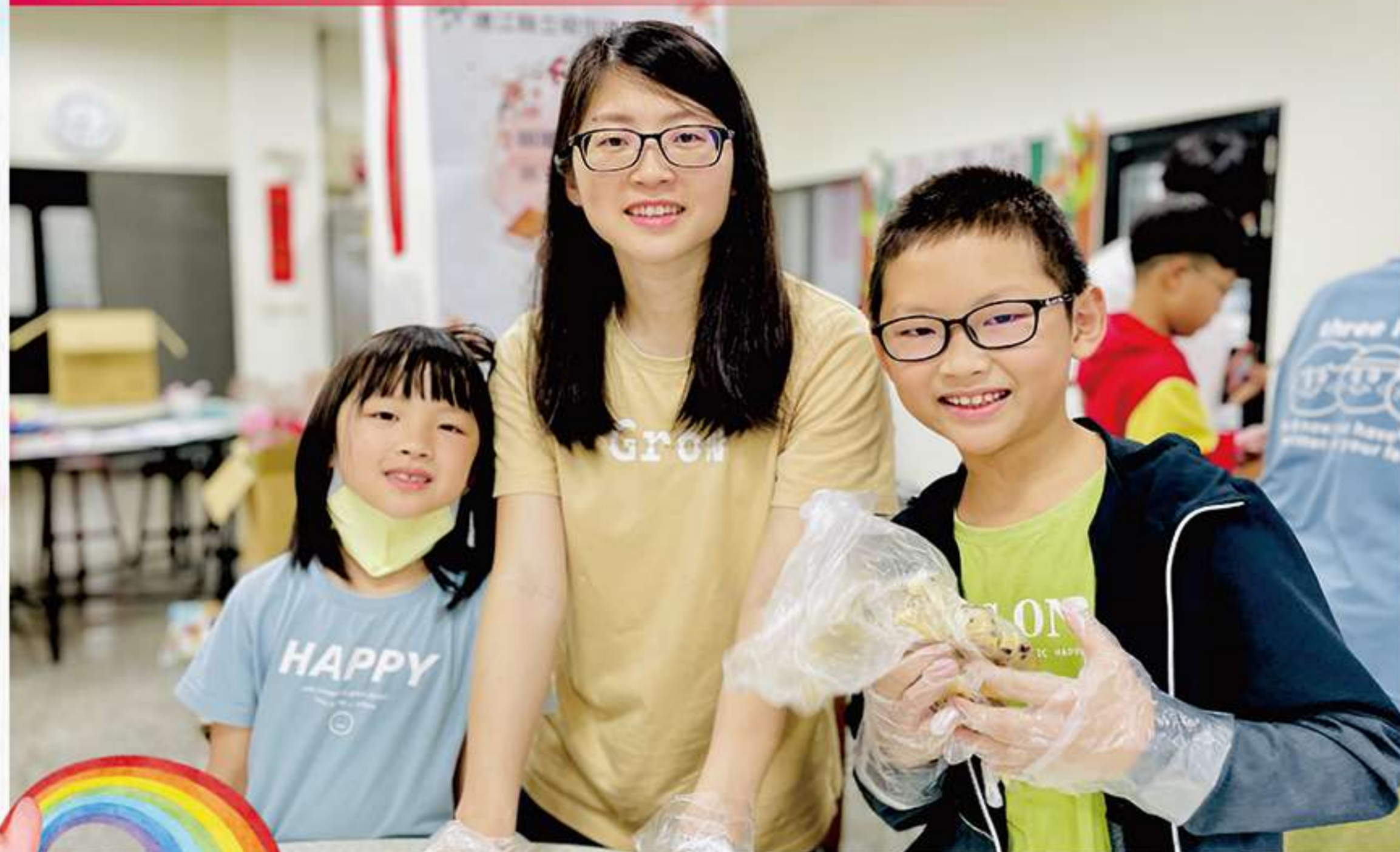
國小輔導室 | 親職活動—親子午茶點心手作