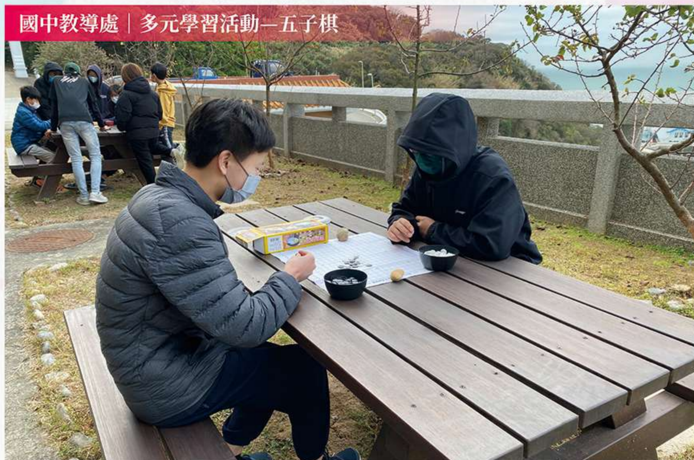
國中教導處 | 多元學習活動—五子棋