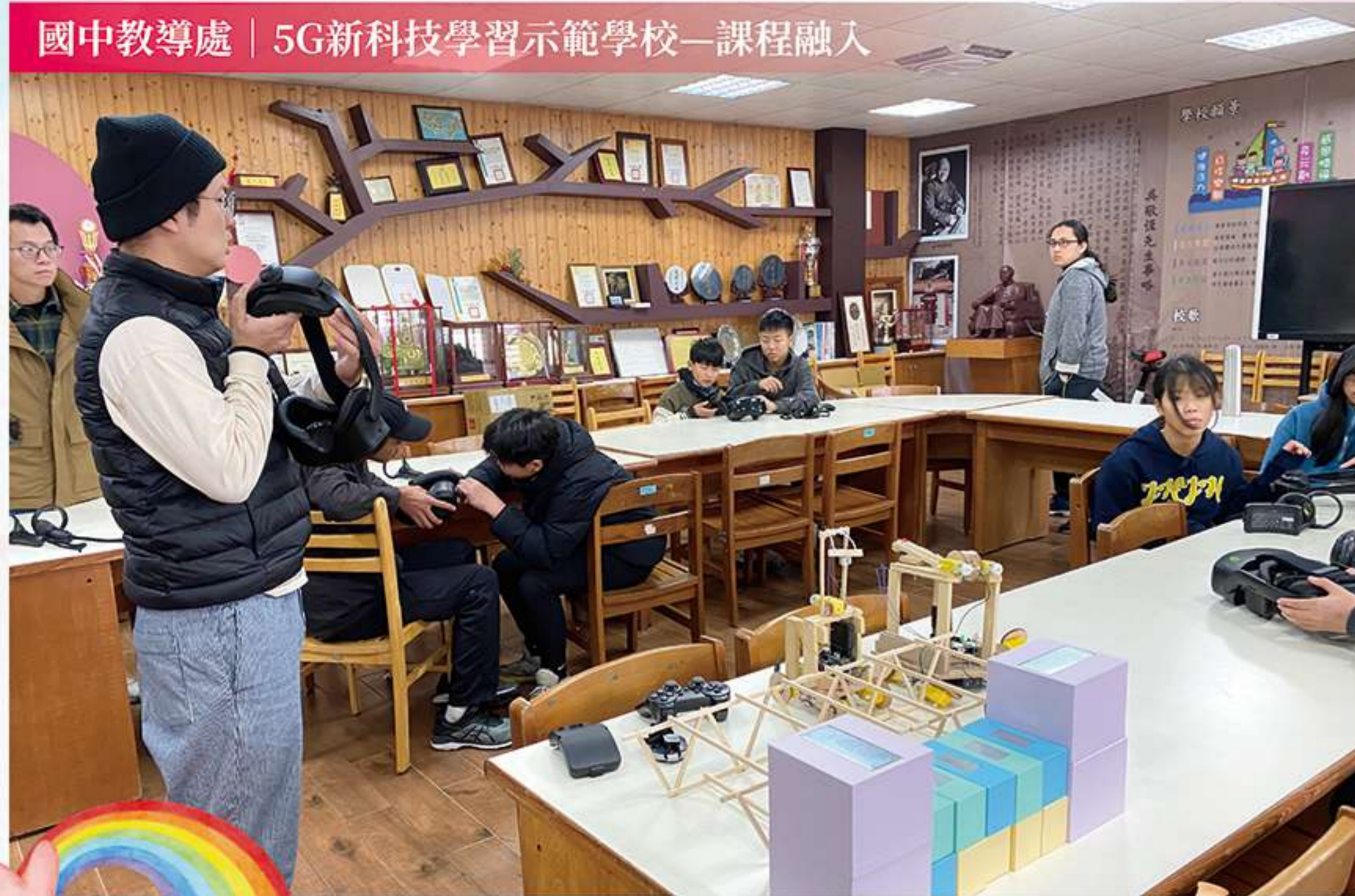
國中教導處 | 5G新科技學習示範學校—課程融入